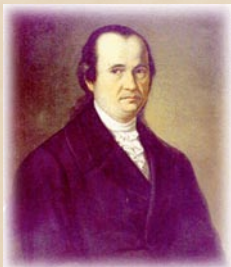
Доситеј Обрадовић Српски просветитељ из Темišвара