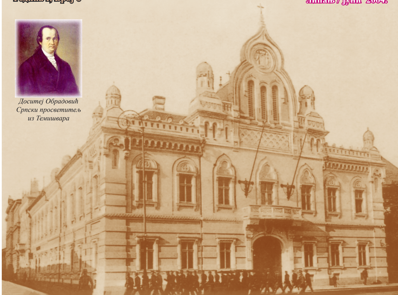
Епархиски дом у Темišвару 1910 године, зграда у којој је била смештена Српска штедионица у Темišвару

Ми знамо да се привреда српског народа може поправити само истрајним радом. Зато се и не уздамо ни у кога, него смо спремни и одлучни да свршавамо све своје послове сами.